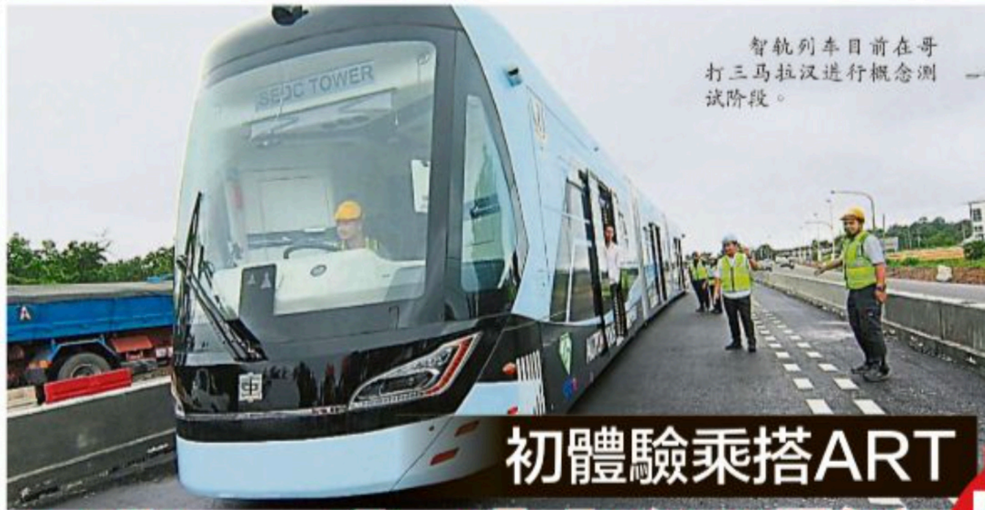
智轨列车目前在哥打三马拉汉进行概念测试阶段。