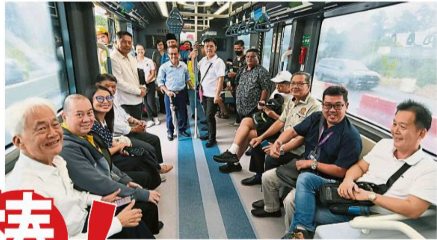
社区及社团领袖受邀参与搭乘体验智轨列车。